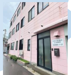
加賀ひきこもり地域支援センター